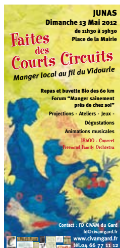
Imprimé sur papier recyclé & encres végétales