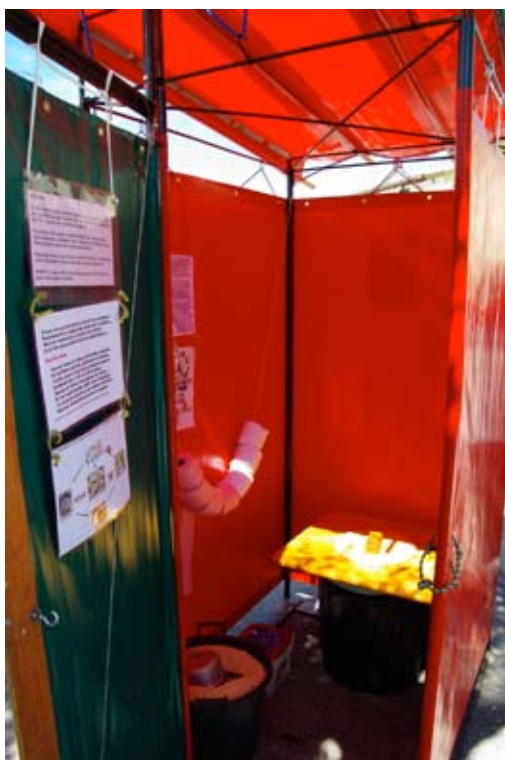
Toilettes sèches démontables - Faites des courts circuits - Junas -