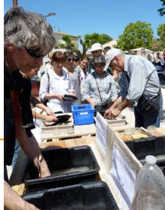
Vaisselle à la cendre - Faites des courts circuits - Junas -